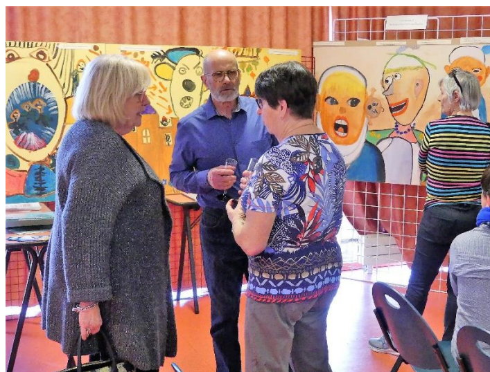
Inauguration à Amboise