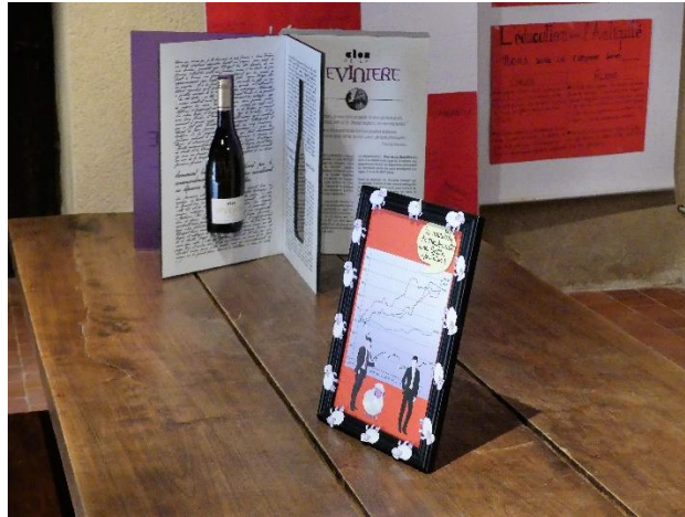
Remise des prix à La Devinière