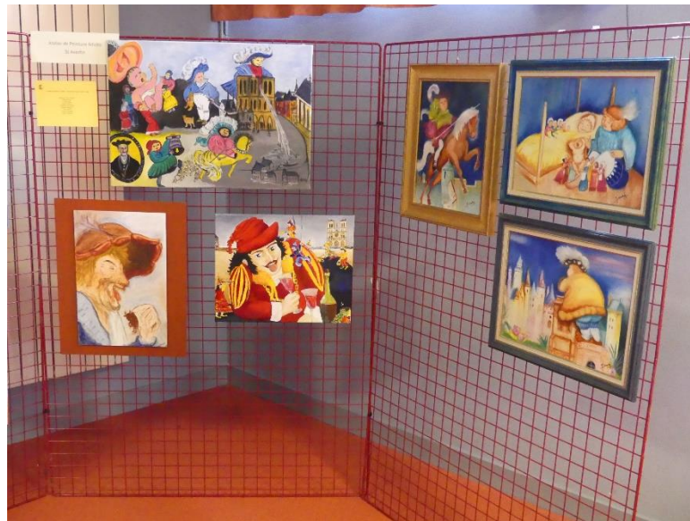
Atelier de Peinture à l'Huile de Touraine Interâges de St Avertin