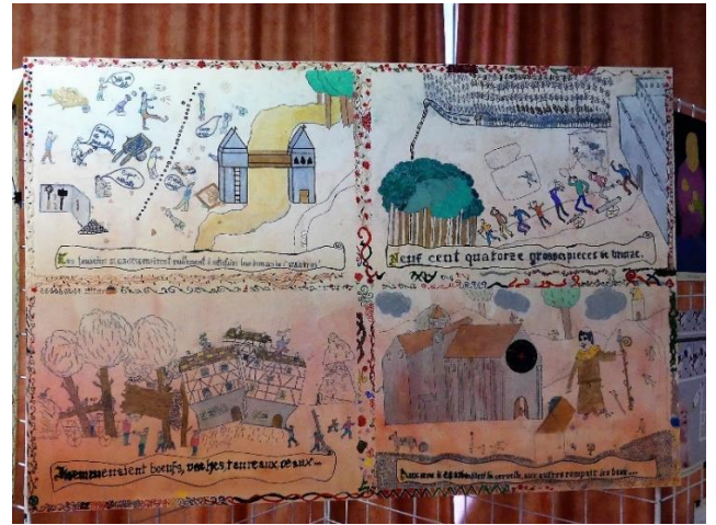
Classes de 6 ème et 5 ème , Collège Pablo Neruda de St Pierre-des-Corps