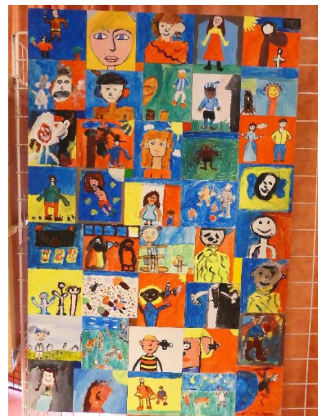
Classe de CM2, école élémentaire de La Membrolle