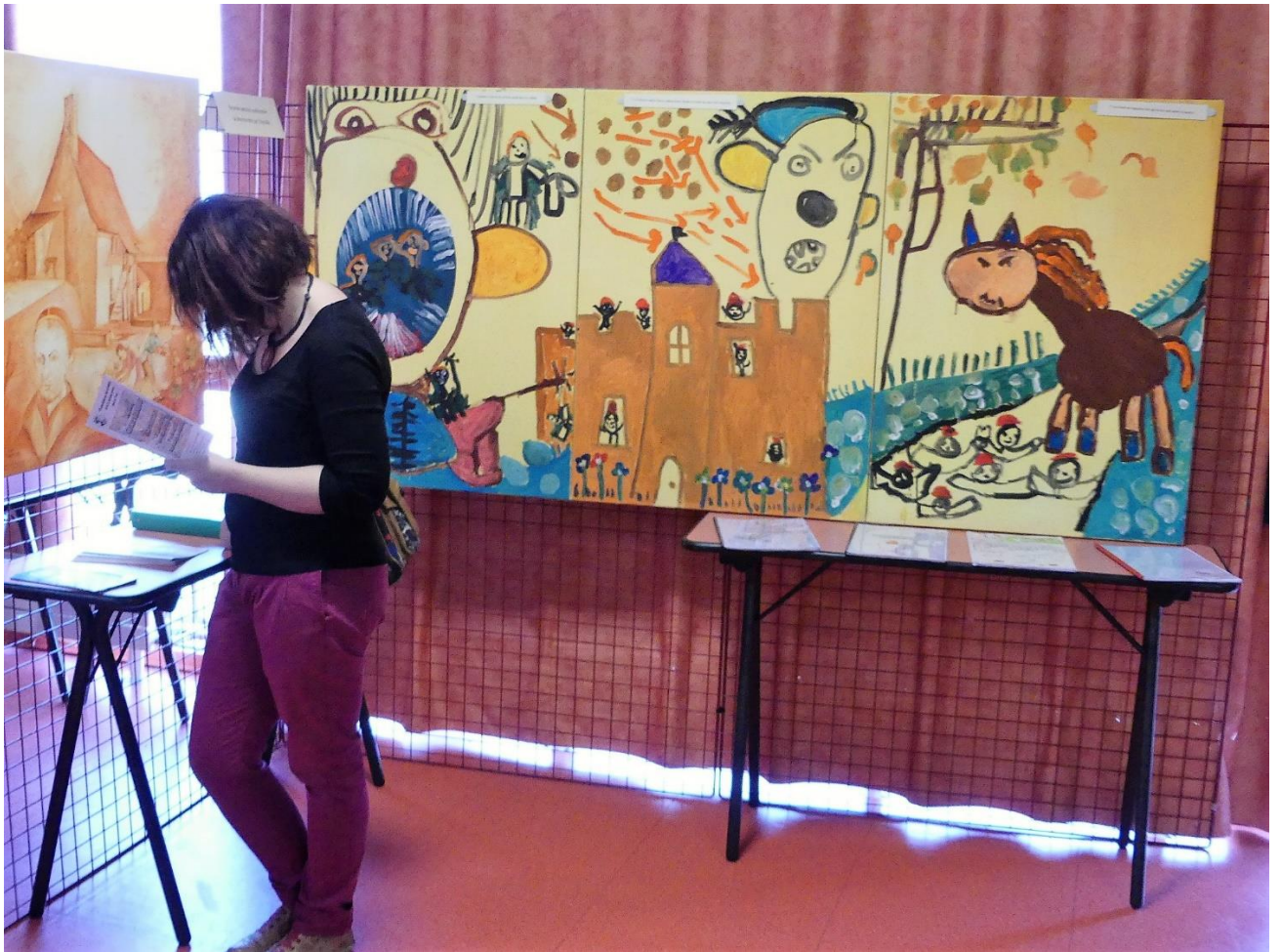
Classe de maternelle (grande section), école de La Membrolle