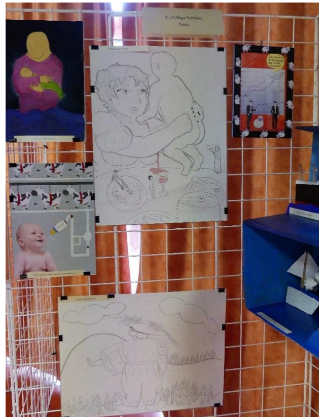
Classe de 4 ème , Collège Rabelais de Tours